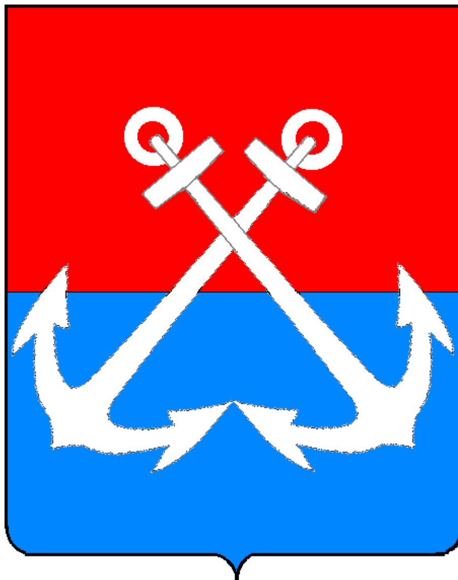
Рисунок 1. Герб муниципального образования Автово (цветной)